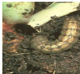
تصاویر مراحل زیستی (تخم لارو شفیره و حشره کامل) کرم طوقه بر